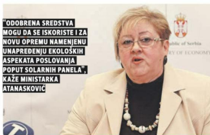
"ODOBRENA SREDSTVA MOGU DA SE ISKORISTE I ZA NOVU OPREMU NAMENJENU UNAPREĐENJU EKOLOŠKIH ASPEKATA POSLOVANJA POPUT SOLARNIH PANELOVA", KAŽE MINISTARKA ATANASKOVIĆ

SRBIJA PREKO MINISTARSTVA privrede finansira sa 1,9 milijardi dinara, a dodatna sredstva od 11 miliona evra za bespovratnu pomoć i tehničku podršku obezbedila je EU koja je prepoznala značaj programa. Bespovratna finansijska pomoć do 5 miliona dinara, odnosno 25 odsto neto vrednosti nove opreme u kombinaciji sa povoljnim kreditima za ostali deo sredstava je svojevrsna pomoć investicijama i brzem razvoju privrednih subjekata proizvodne i građevinske delatnosti.