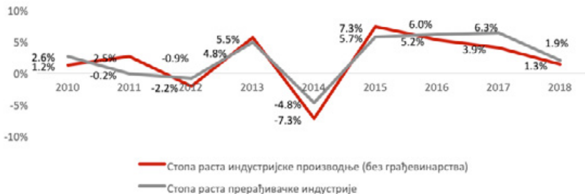
Илустрација 2: Стопе раста индустријске производње (без грађевинарства) и прерађивачке индустрије по годинама, 2010 – 2018. године

Истовремено, учешће индустријске производње у БДП није се значајније мењало – индустрија је чинила око ¼ БДП.