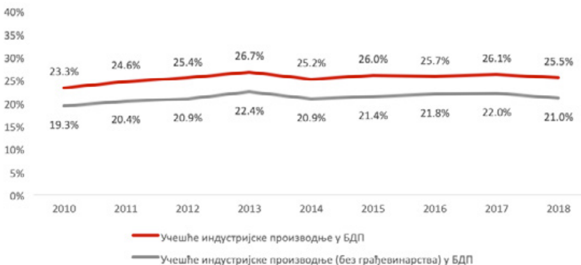
Илустрација 3: Учешће индустријске производње у БДП по годинама, 2010 – 2018. године

Истовремено, учешће индустријске производње у БДП није се значајније мењало – индустрија је чинила око ¼ БДП.