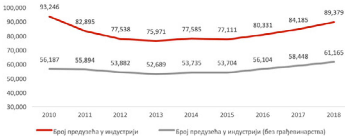
Илустрација 4: Укупан број предузећа у индустрији Републике Србије, 2010 – 2018. године

Током анализираних периода од 2010. до 2018. године није било значајнијих промена у укупном броју привредних друштава у индустрији, као ни у структури у оквиру укупног броја, формираној према делатности предузећа.