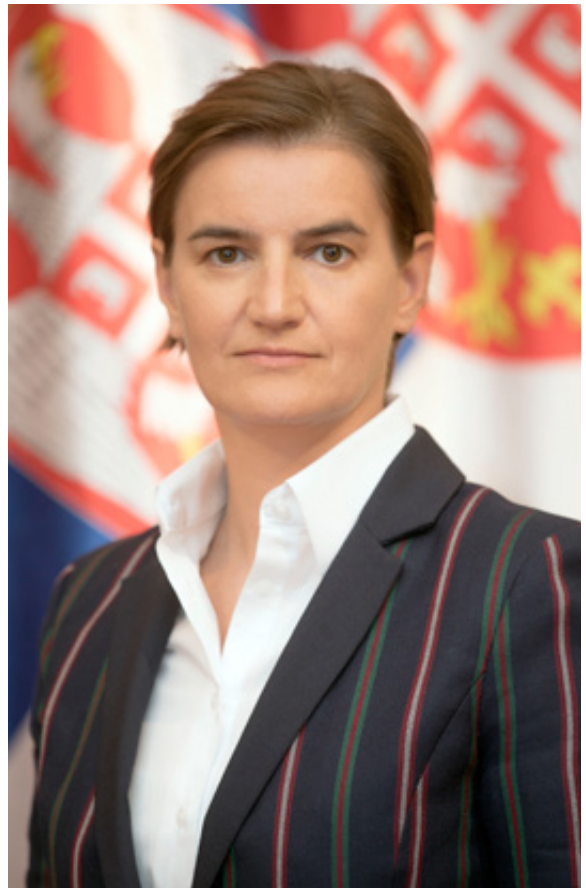
У Београду, 27. фебруара 2020. Председник Владе Републике Србије Ана Брнабић

Ако будемо успешни, БДП Србије ће у наредној деценији расти брже од 5% годишње, и сви грађани ће имати прилику да виде резултат напорног рада протеклих година, који ће се огледати у већим платама, већом понудом бољих послова, више прилика за рад у међународним компанијама са седиштем у Србији, и квалитетом живота на европском нивоу. ■■■